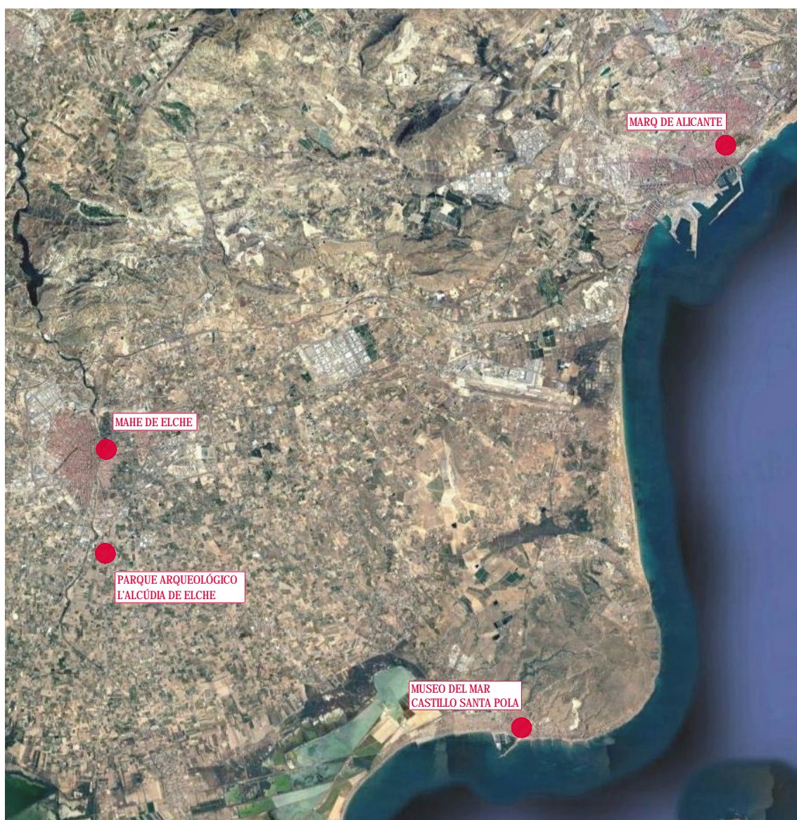
Plano 1.6.4.1. - Situación del Museo del Mar, MARQ, MAHE y Alcudia

Las conexiones históricas del patrimonio santapolero con su entorno provincial, erigido como el puerto comercial y la salida al mar de la colonia romana ilitana y enmarcado en el desarrollo social y político del territorio levantino plantean la necesidad de desarrollar estrategias comunes interprovinciales desde una perspectiva no sólo científica, sino también cultural y turística, constituyendo un activo económico intermunicipal.