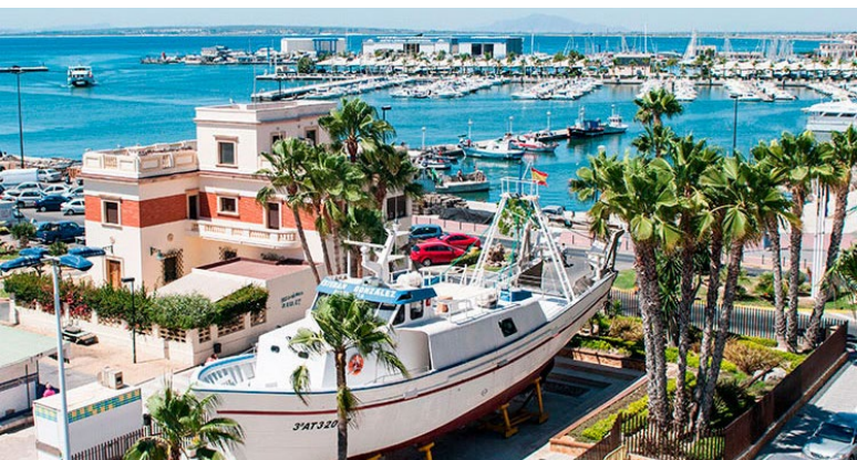
F.1.1.2. - Museo del Mar Barco Pesquero