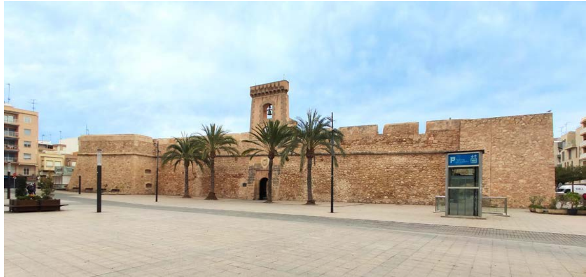
Foto 1.1.1. - Museo del Mar

nocido como Monumento BIC (R-I-SI-0008252) con nivel de protección integral. El Castillo-Fortaleza está, además, incluido como “Monumento” en la Sección 1ª de Bienes de Interés Cultural de la Conselleria de Educación, Cultura y Deporte de la Generalitat Valenciana desde 1993, definido su uso actual como museístico e inscrito en el Registro General del Patrimonio Histórico Español.