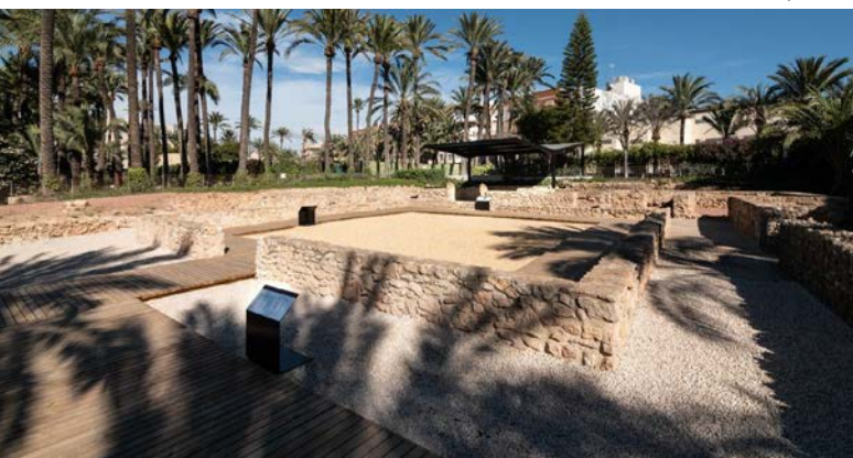
Foto 1.1.3. - Portus Illicitanus