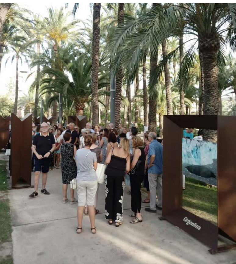
Foto 1.1.4. - Sala de exposición exterior

Junto a la sede principal, ubicada en el Castillo Fortaleza, destacan en la actualidad dos SALAS EXTERNAS musealizadas en directa dependencia en su creación, gestión y divulgación del Museo del Mar como son el Museo del Mar-Barco Pesquero (etnografía) y el recientemente creado Museo del Mar Portus Illicitanus (arqueología) que además acoge la Villa romana del Parque el Palmeral. De este modo, el nuevo espacio musealizado y el resto de sedes pasan a ser salas externas y cuentan con todo el nivel de protección oficial que posee el Museo del Mar. Además de estas dos salas externas, la sede principal del museo cuenta con una prolongación exterior de su parte expositiva, una sala de exposiciones al aire libre constituida por unos marcos metálicos diseñados para acoger diferente contenido renovable y ubicados en el Parque el Palmeral. Todo este conjunto de sede y salas se gestiona desde el Museo del Mar como denominación principal y con una identidad visual corporativa cuya marca funciona como marca paraguas.