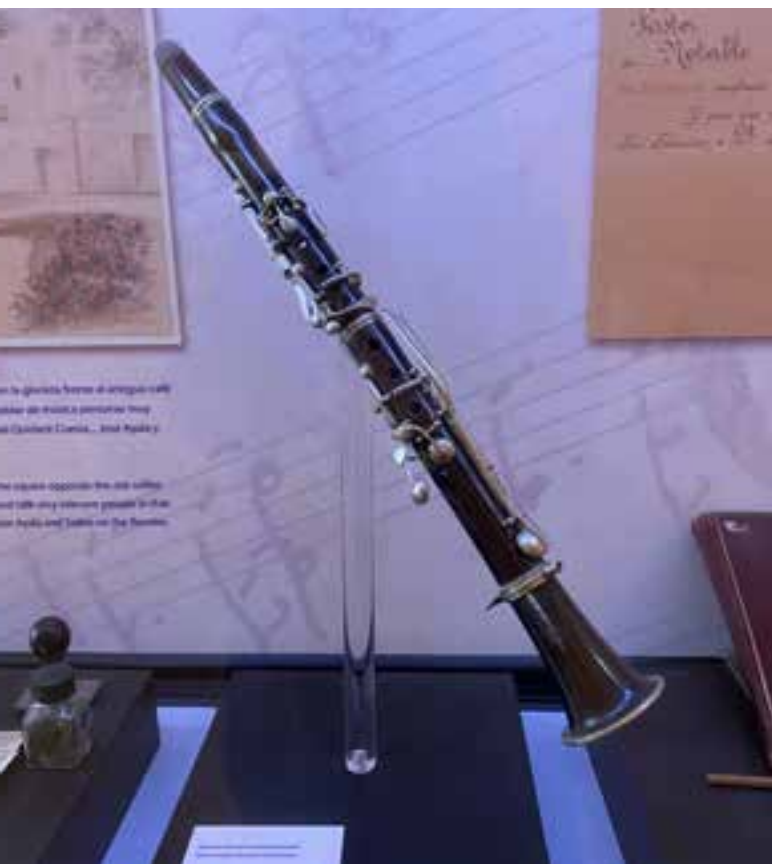
Imagen 2.1.3.21. - Colección de música

La colección del legado del Maestro Quisilant tiene un volumen total de 33 objetos que se encuentran inventariados. Cabe destacar entre los elementos más relevantes de esta colección el piano, un requinto, mobiliario personal del compositor, fotografías y objetos relacionados con el desarrollo de su profesión.