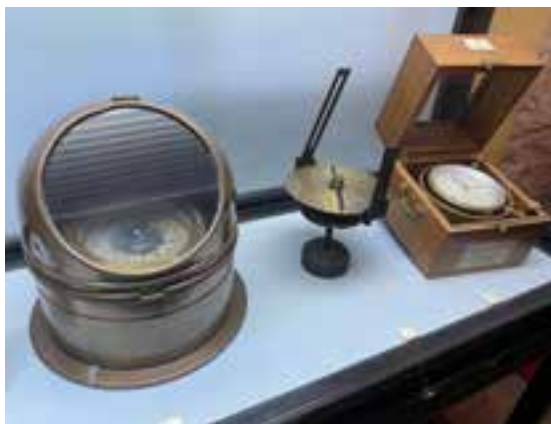
Imagen 2.1.3.11. - Instrumentos navegación

Esta colección relacionada con la importante historia naval y marinera de Santa Pola se compone de diferentes instrumentos de navegación como son sextantes, corredera de hélice y con reloj registrador, faro de luz para código Morse, reloj de guardias, compases líquidos, barómetros, instrumentos de medición de cartas náuticas, derroteros, etc.