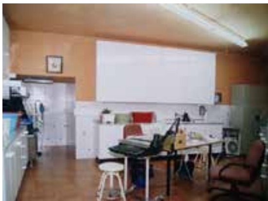
Foto 2.5.8.1. - Laboratorio de arqueología

Durante los primeros años de funcionamiento de la institución se vino realizando un trabajo de restauración de piezas arqueológicas y etnográficas que necesitaran tratamiento para garantizar su conservación e integridad, posibilitando que formaran parte de la exposición permanente y facilitando su comprensión por parte del público.