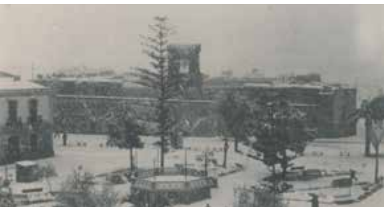
Imagen 2.1.3.15. - Colección fotográfica