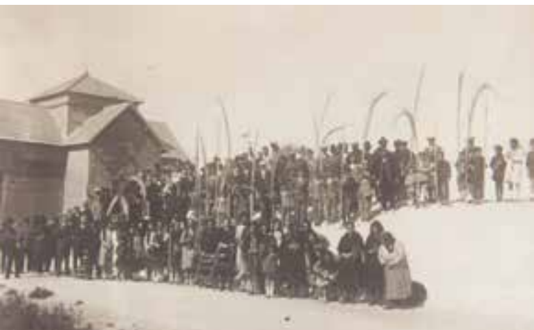
Imagen 2.1.3.14. - Colección fotográfica

Entre las labores de recopilación documental, el Museo del Mar dispone de un archivo de carácter gráfico del que destacan los fondos fotográficos, conformados por fotografías originales, negativos, reproducciones o copias, etc., resultado tanto del registro científico de información, como de depósitos y donaciones particulares.