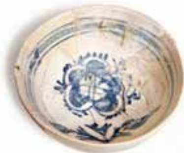
Imagen 2.1.3.3 - Plato de cerámica vidriada

- El material de cronología prehistórica, procedente del poblamiento de la Cova de les Aranyes del Carabassí.