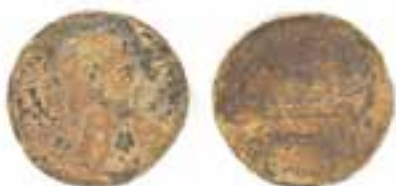
Imagen 2.1.3.9. - Colección numismática

La colección numismática está constituida, principalmente, por monedas romanas procedentes de las excavaciones del Portus Ilicitanus . Esta colección se ha visto incrementada a partir de donaciones de particulares resultantes de hallazgos fortuitos en el entorno de la ciudad. Este conjunto monetario se halla catalogado e informatizado.