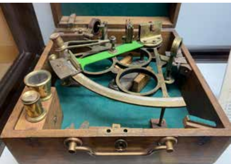
Imagen 2.1.3.13. - Instrumentos navegación