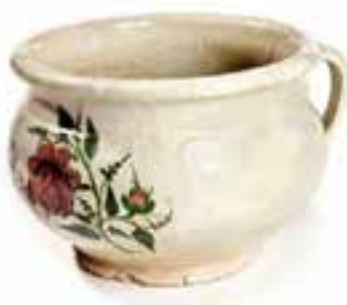
Imagen 2.1.3.6. - Bacín

Esta colección se ha ido formando a partir de un nutrido conjunto de objetos recopilados, tales como indumentaria de trabajo, mecanismos de gobierno de barcos, velas, diferentes tipos de nudos, herramientas de carpintería de ribera, elementos de pesca como redes, anzuelos, arpones y poteras, etc., y toda una serie de elementos vinculados con las actividades cotidianas de una comunidad que ha