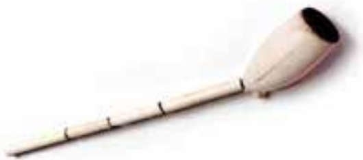
Imagen 2.1.3.5. - Pipa de espuma de mar

La colección etnográfica relativa al mar procede de donaciones de diversas instituciones locales y de particulares, y reconstruye las actividades de la pesca y de la vida cotidiana de un pueblo de pescadores en los siglos XIX y XX.