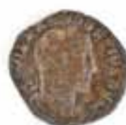
Imagen 2.1.3.10. - Colección numismática