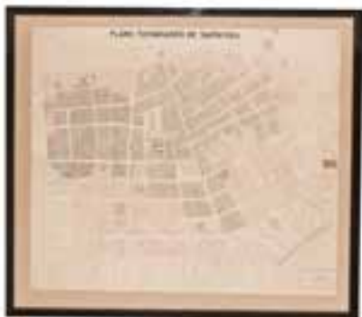
Imagen 2.1.3.17. - Colección cartográfica