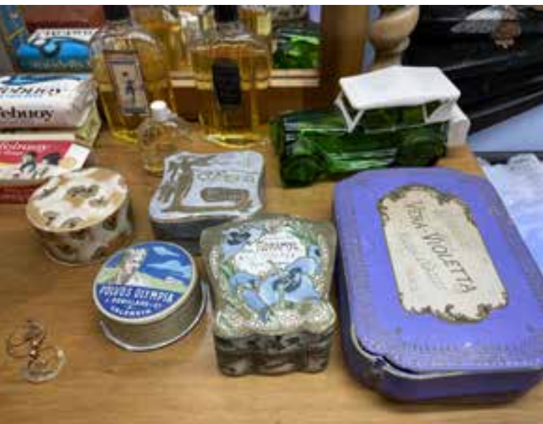
Imagen 2.1.3.7. - Colección etnográfica

estado dedicada casi exclusivamente a trabajos relacionados con el mar.