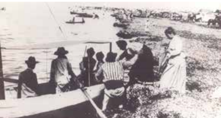
Imagen 2.1.3.16. - Colección fotográfica

Esta colección está integrada por un conjunto muy heterogéneo de imágenes de diversa índole. Por un lado, las imágenes resultado de las campañas arqueológicas y la recopilación de información gráfica dentro del proceso del trabajo de investigación y método de registro, obteniendo imágenes tanto de los espacios de trabajo de campo como de los materiales excavados.