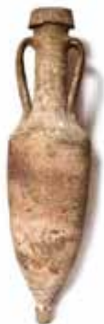
Imagen 2.1.3.4. - Ánfora romana

- El material resultante de diferentes actuaciones puntuales derivadas de obras públicas del municipio, obras que conllevan el correspondiente seguimiento arqueológico cuyos informes, memorias y materiales se depositan en el museo.