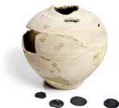
Imagen 2.1.3.8. - Colección numismática

La colección numismática está constituida, principalmente, por monedas romanas procedentes de las excavaciones del Portus Ilicitanus . Esta colección se ha visto incrementada a partir de donaciones de particulares resultantes de hallazgos fortuitos en el entorno de la ciudad. Este conjunto monetario se halla catalogado e informatizado.