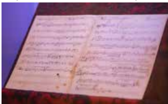
Imagen 2.1.3.18. - Colección cartográfica

La colección de tipo cartográfico y militar está compuesta, principalmente, por documentación relativa al Castillo-Fortaleza, sobre todo desde el siglo XVII, que subraya su valor defensivo, su posición geográfica y estratégica, su entorno inmediato y el núcleo de crecimiento urbano de Santa Pola en las últimas décadas.