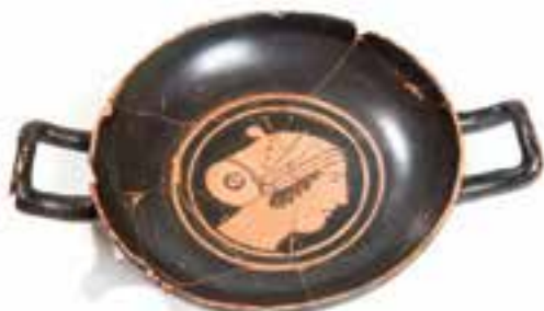
Imagen 2.1.3.2. - Kylix cerámica