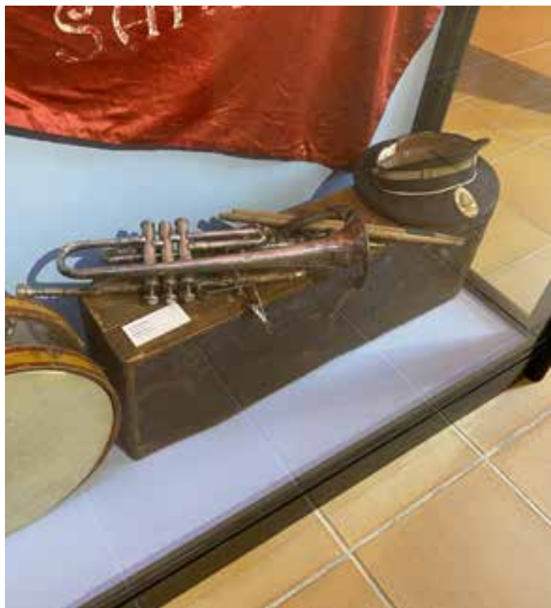
Imagen 2.1.3.22. - Colección de música