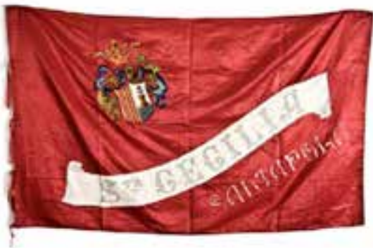
Imagen 2.1.3.20. - Estandarte banda

El Museo del Mar atesora el legado documental del Maestro Quisilant, músico y compositor de Santa Pola. Esta colección se compone esencialmente de partituras originales, aunque también se conservan libretos y otros elementos relacionados con la música y con la actividad profesional de este compositor.