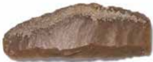
Imagen 2.1.3.1. - Lámina retocada de sílex

La colección arqueológica procede de las diferentes excavaciones que se han llevado a cabo en Santa Pola, tanto de carácter académico como resultado de depósitos de material fruto de excavaciones en obra urbana o hallazgos fortuitos. Se compone principalmente por: