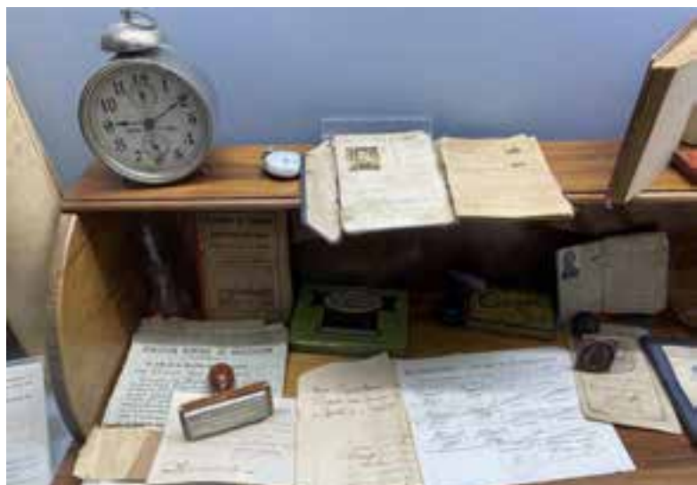
Imagen 2.1.3.12.- Instrumentos navegación

Esta colección relacionada con la importante historia naval y marinera de Santa Pola se compone de diferentes instrumentos de navegación como son sextantes, corredera de hélice y con reloj registrador, faro de luz para código Morse, reloj de guardias, compases líquidos, barómetros, instrumentos de medición de cartas náuticas, derroteros, etc.