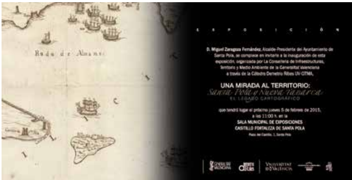
Imagen 2.1.3.19. - Colección cartográfica

El carácter eminentemente militar justifica la abundante representación cartográfica del edificio, centrada sobre todo en la descripción de la fortaleza en su condición de plaza fuerte, con especial interés en su posición geográfica-estratégica.