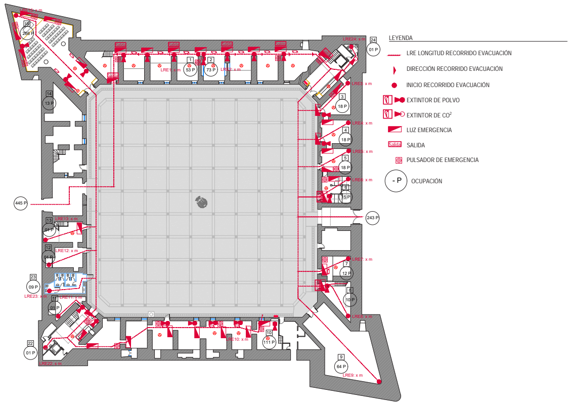
Plano 6.2.1a. - Plano de evacuación contra incendios en PB