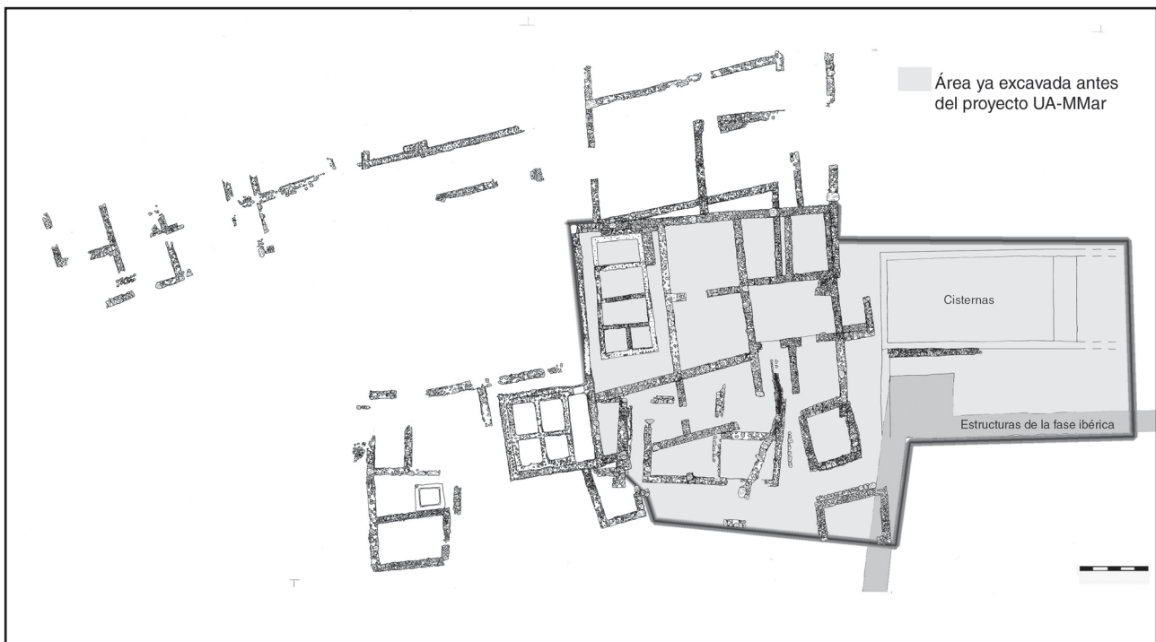
Figura. 1.1. Zona de intervención previa al proyecto UA-Museo del Mar (en gris) (Elaboración propia)

El yacimiento de "La Picola" (Polígono Urbano de Salinas, Santa Pola) ha pasado por distintas fases de excavación desde su descubrimiento en la década de los 70 del siglo XX. En 1977 se realizaron las primeras intervenciones de emergencia, seguidas hasta 1989 por una serie de campañas encabezadas por el Museo del Mar de Santa Pola (Figura 1.1). Desde 1991 hasta 1995, un equipo hispano-francés dirigido por F. Rouillard, M.J.Sánchez y R Sillières, centrándose de forma especial en las estructuras más antiguas. (Molina Vidal, 2022: 94)