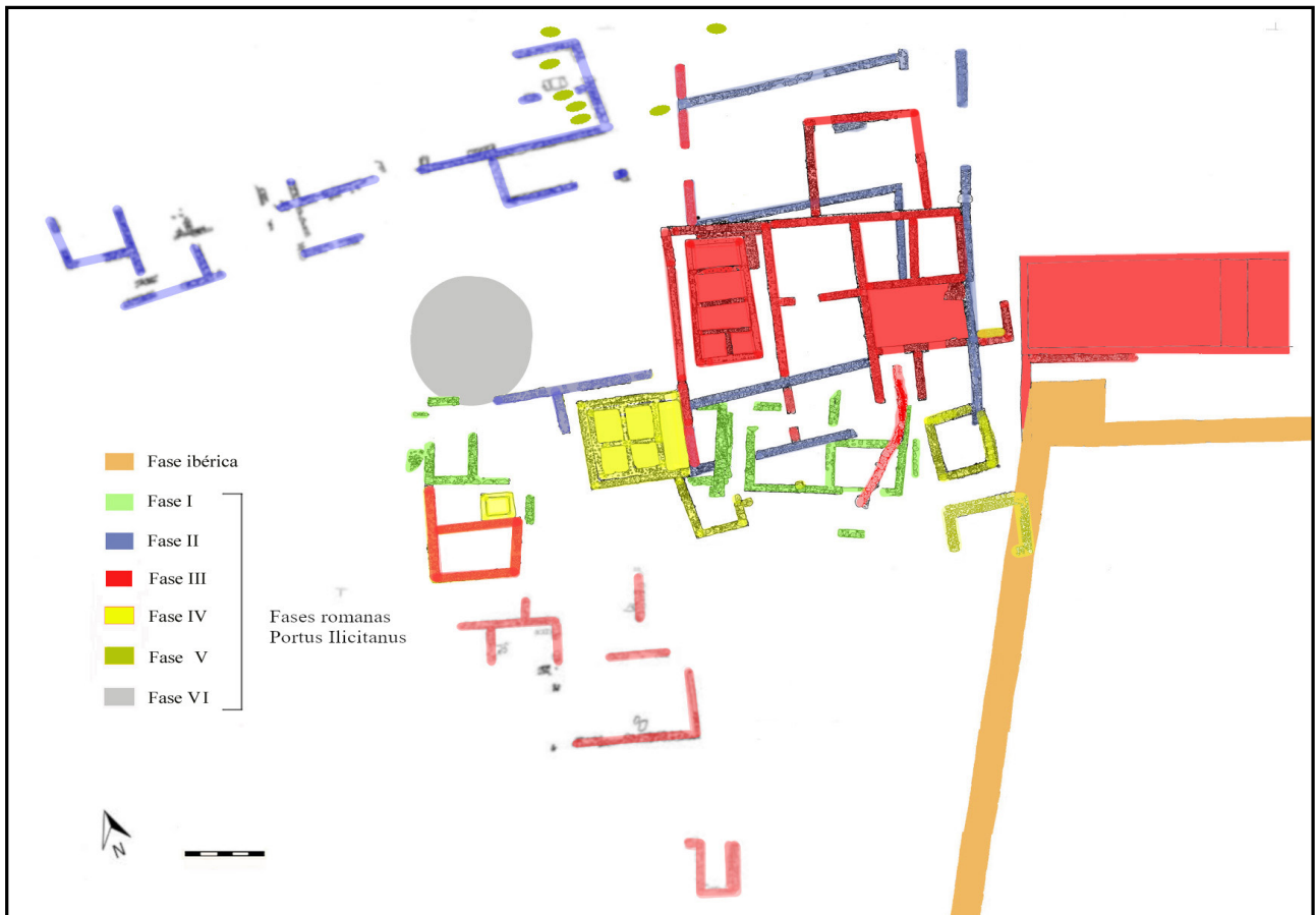
Figura. 1.2. Fases y subfases del yacimiento de "La Picola" (Álvarez Tortosa et al., 2021: 125 fig. 5. Elaborado a partir de Molina Vidal, 2022: 96 fig. 4 y 98 fig. 7).

municipio y que han sido puestos en valor, se han encontrado con la dificultad propia de los yacimientos arqueológicos situados debajo de ciudades modernas. A lo que se debe añadir una constante presente en buena parte de la costa sudoriental española: la fortísima presión urbanística . A pesar de ello, nuevos descubrimientos y elementos de análisis sobre la evolución histórica de este enclave han ido acumulándose durante las últimas décadas, especialmente desde la creación del Servicio de Investigación Arqueológica del Museo del Mar de Santa Pola.