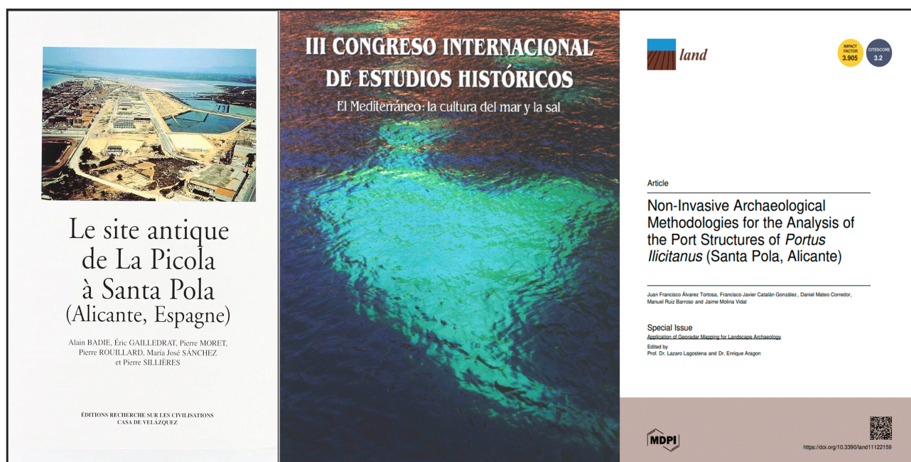
Figura 1.4. Publicaciones científicas relacionadas con el yacimiento arqueológico de “La Picola”

Este Plan Director tiene como objeto exponer las líneas generales de actuación en el yacimiento arqueológica de “La Picola”, sentando las bases para conseguir la puesta en valor del bien a partir de la elaboración de diversas propuestas y planes de trabajo que en su conjunto crearán la infraestructura necesaria para convertir y/o consolidar este bien patrimonial como un referente a nivel cultural.